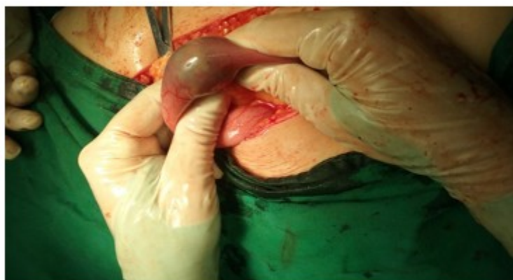
Foto 1. Muestra la imagen del cálculo dentro de la luz del intestino