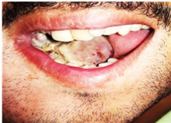
Fig. 2 Imagen donde se observa una masa blanquecina indurada, pediculada proveniente del suelo de boca que desplazaba la lengua hacia la izquierda.

Se procedió a realizar tomografía axial computarizada, (Figura 3), la cual reveló imagen hipodensa con captación heterogénea del medio