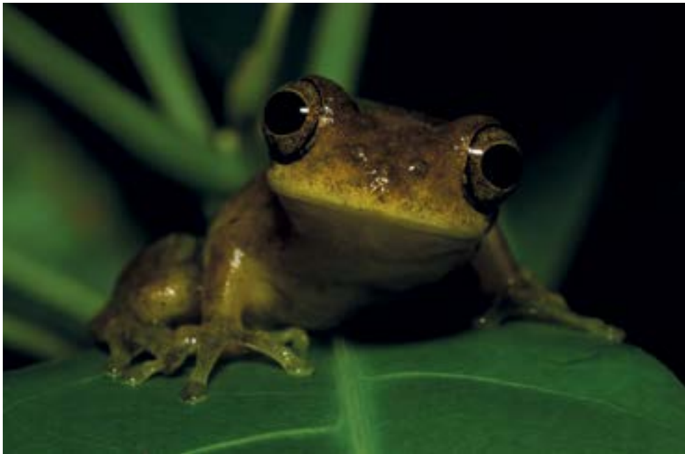
Dendropsophus sp. (Rana) Rio Tiquie, Vaupes, Colombia.