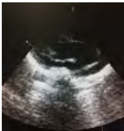
Figura 3. Ecocardiograma TT del caso. No se observa coartación.

El gen TGFBR2 codifica para el factor de crecimiento transformante beta-2 (TGF- \beta 2), el cual se encuentra presente en todo el organismo. Para cumplir con sus funciones el TGF- \beta 2 se une a sus receptores en la superficie celular, los cuales son codificados por los genes TGFBR1 y TGFBR2 [4]. Específicamente, el TGFBR2 pertenece a la familia de quinasas de serina / treonina transmembrana y consiste en un ectodominio N-terminal de unión al ligando, una región transmembrana y un dominio de serina / treonina quinasa en la región C-terminal. El ectodominio está formado por nueve hebras beta y una única hélice alfa estabilizada por una red de seis enlaces disulfuro intra-hilos [17].