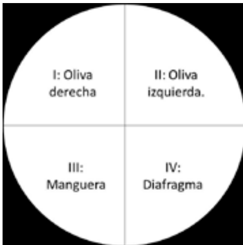
Figura 1. Disposición de las cajas de Petri para la siembra de las muestras tomadas a partir de los estetoscopios.

A los 50 estudiantes que participaron en el estudio se les solicitó el estetoscopio para tomar muestras de cuatro partes de estos (oliva derecha, oliva izquierda, manguera y diafragma) por medio de frotis con hisopo húmedo. Las muestras fueron sembradas en cajas de Petri con agar nutritivo, las cuales fueron divididas en cuatro partes rotuladas I: oliva derecha, II: oliva izquierda, III: manguera y IV: diafragma (véase figura 1 ).