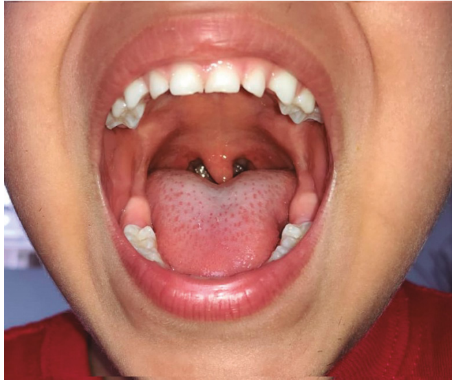
Figura 2. Respuesta del paciente luego de la dosis de corticoide con resolución completa de la sintomatología.

les pueden llevar a la manifestación de la enfermedad [21]. Kettunen y colaboradores encontraron que la falta o disminución en el tiempo de la lactancia materna, el tabaquismo materno y el uso de productos naturistas o hierbas medicinales, así como la presencia de acuarios en casa pueden proporcionar una fuente microbiana respiratoria y ser factores de riesgo independientes para desarrollar síndrome PFAPA [21].