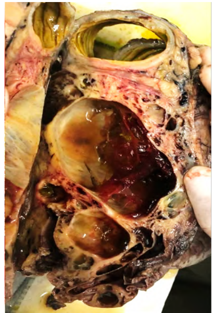
Figura 1. (A y B) Masa íntimamente adherida a la pared del colon transverso, de aspecto multiquístico y altamente vascularizada.