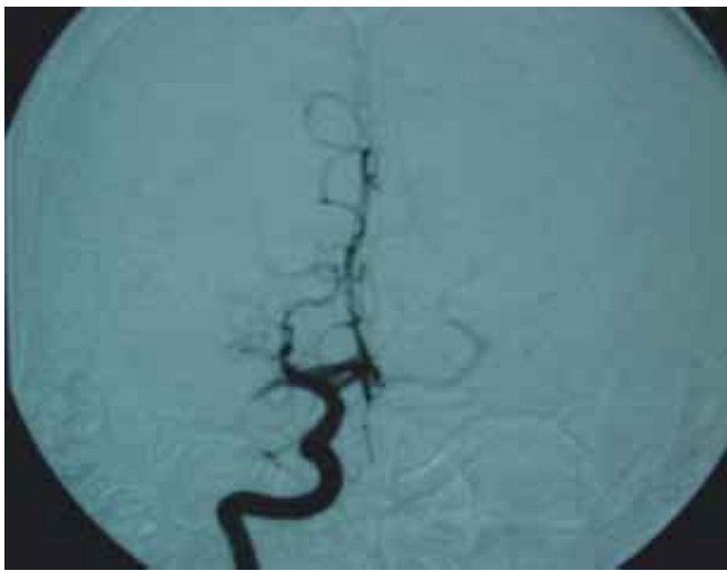
Figura 1. Angiografía digital proyección AP. Trombosis de ACM (arteria cerebral media) derecha, con presencia de trombo en segmento M1 derecho a 1 cm del origen.

da con caída de su propia altura, afasia y hemiplejía fasciobraquial izquierda. Acudió al servicio de urgencias de este hospital, de acuerdo al cuadro clínico y estudios realizados se le realizó el diagnóstico de trombosis de la arteria cerebral media derecha. Por lo que se sometió a trombólisis, evolucionando satisfactoriamente.