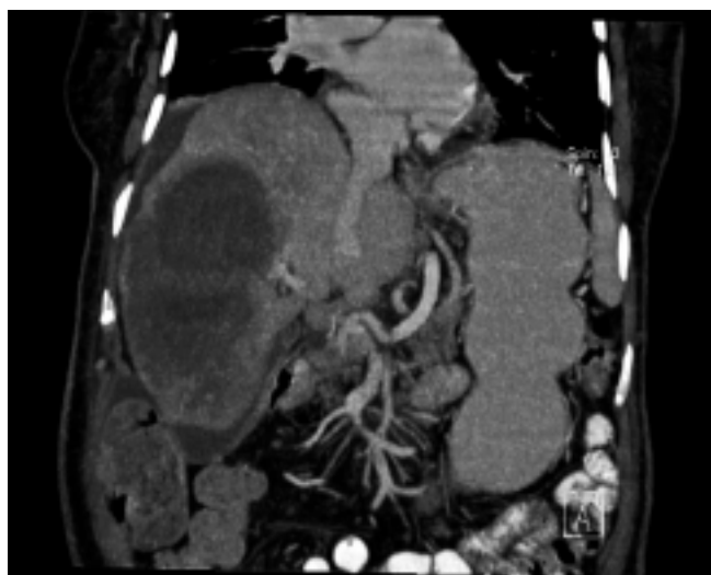
Figura 1. Metástasis hepáticas.

A la exploración física se observó palidez de mucosas y tegumentos, regularmente hidratada, abdomen distendido, doloroso, difuso con predominio en epigastrio, no hepato ni esplenomegalia. La radiografía de tórax de ingreso con elevación de hemidiafragma derecho con derrame pleural. Los resultados de laboratorio con leucocitosis de 15,500/ \mu L con neutrofilia, bilirrubina total 1.30 mg/dL, ALT 22.0 U/L, AST 39.0 U/L, fosfatasa alcalina