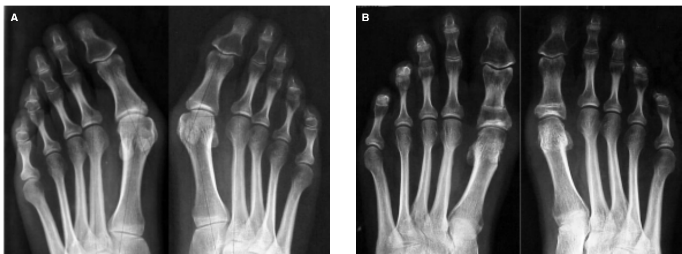
Figura 2. Estudios radiográficos dorsoplantares de ambos pies en el prequirúrgico (A) y el posquirúrgico (B) a 12 meses.

Para el análisis estadístico se utilizó SPSS v. 13 (SPSS, Chicago, Ill). Se realizó análisis descriptivo de las varia-