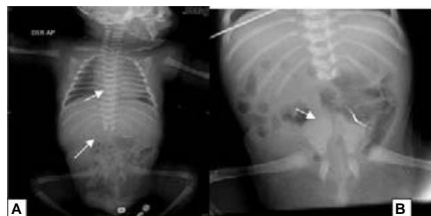
Figura 2 A. Cardiomegalia con índice cardiorácico de 0.62 (flecha superior) y agenesia de la columna lumbosacra desde L2 (flecha inferior). B. Articulación medial de ambos huesos ilíacos (flecha).