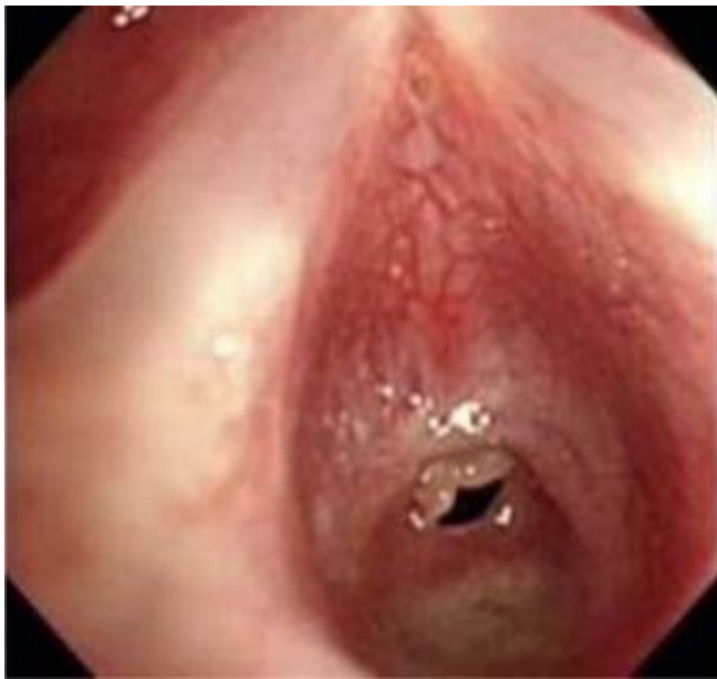
Figura 1. Estenosis subglótica adquirida inicial del 74%.