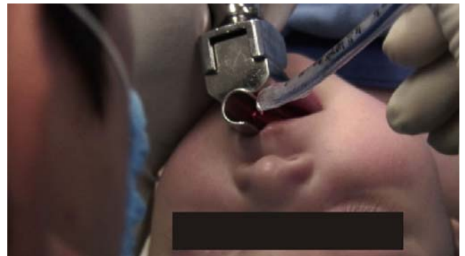
Figura 3. Dilatación con cánulas endotraqueales con guía metálica.

paciente controlando la presión con manómetro y dejándolo insuflado por 60 segundos en 3 ocasiones cada una ( Figura 4 ).