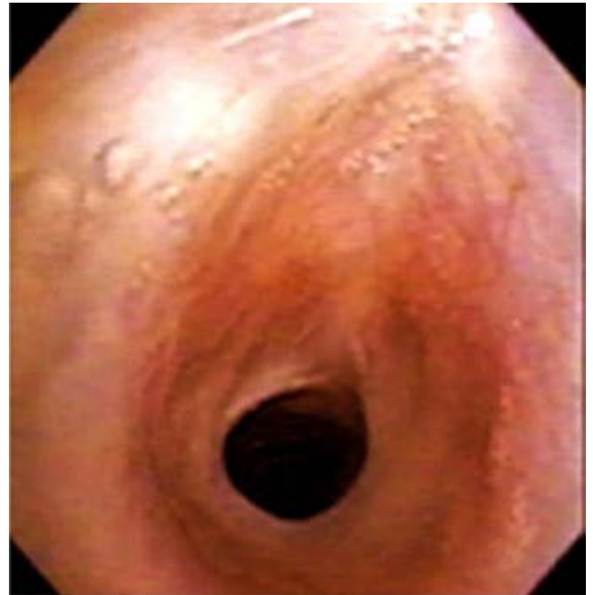
Figura 2. Estenosis subglótica adquirida residual del 10% posterior a dos dilataciones.