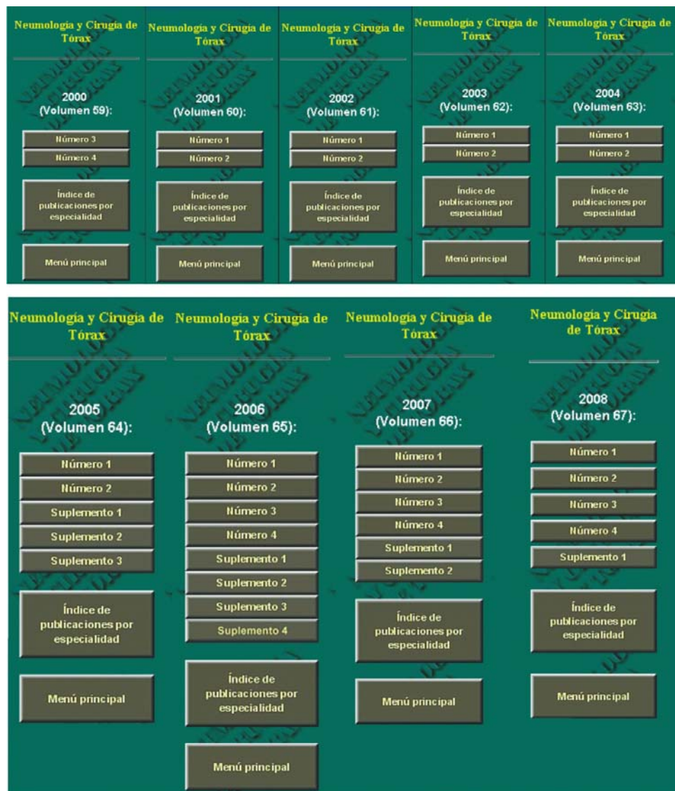
Figura 1. En el panel superior mostramos la periodicidad semestral con que había venido siendo publicada la revista (2000-2004), a partir de 2005 se buscó la estrategia para poder aumentar el número de revistas publicadas al año, y a partir de 2006 se logró tener una periodicidad trimestral como se muestra en el panel inferior, para poder aparecer en los índices de consulta de las revistas médicas.

mente ya estamos en algunos índices de consulta (Figura 2). Desde el año 2006 Neumología y Cirugía de Tórax fue incluida en INCILAT, que es una base de datos que permite al usuario hacer una búsqueda efectiva de citas o referencias bibliográficas por autor o revista en la bibliografía de las revistas participantes, permite entre otros recursos, determinar el número de citaciones que tiene algún autor o revista en la bibliografía incluida en los artículos de las revistas que actualmente conforman el acervo del índice Medigraphic-Artemisa, otras funciones de INCILAT contemplan determinar el factor de impacto y de inmediatez de las publicaciones incluidas.