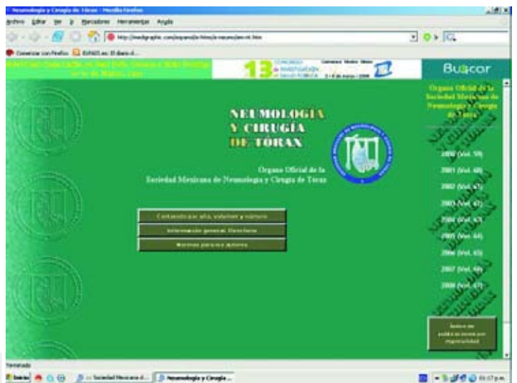
Figura 3. La revista se puede consultar en su formato impreso en papel, o bien a través de vía electrónica de la página de la SMNyCT o del portal de Medigraphic ( www.medigraphic.com/neumologia ).