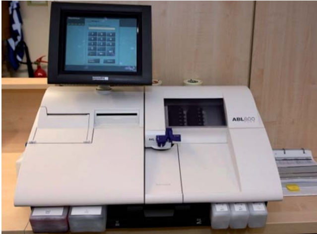
Figura 2. Gasómetro modelo ABL Flex 800 (Radiometer, Copenhagen, Denmark).