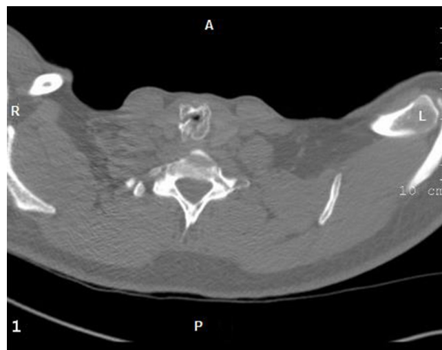
Figura 1: Tomografía axial computarizada. Vista axial. Se observa la fractura del cartílago cricoides y el pequeño orificio de la luz de la VR a ese nivel.

En pacientes como los ya presentados, nunca se insistirá bastante en los cuidados intraoperatorios, cuando se realiza la movilización circunferencial de los bordes lesionados, porque aumenta el riesgo de la desvascularización de los extremos a anastomosarse y la posibilidad de dehiscencia