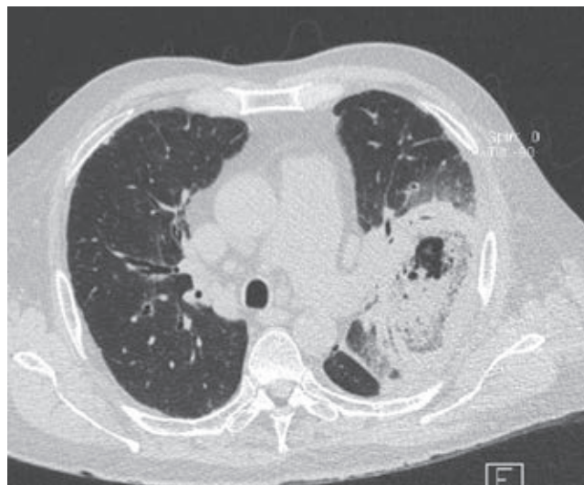
Figura 2: Tomografía computarizada de tórax. Muestra una masa cavitada bien definida dentro del lóbulo superior izquierdo, con el signo de la media luna de aire. Se observan nódulos de diferentes tamaños alrededor de la lesión y en el lóbulo superior izquierdo.