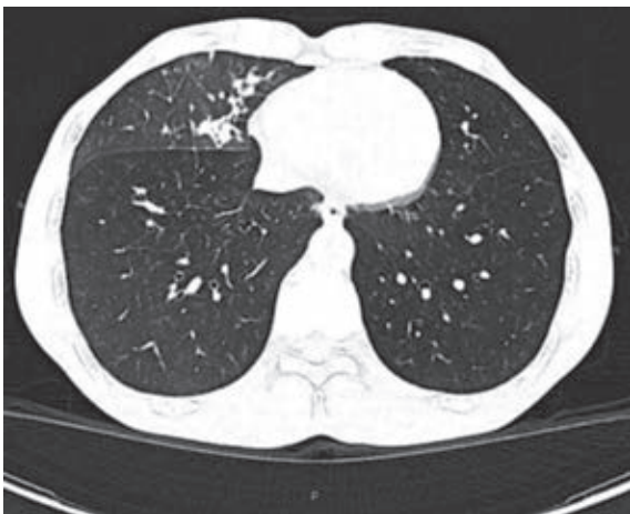
Figura 1: Tomografía de tórax en ventana para parénquima con patrón de llenado alveolar en lóbulo medio asociado a nódulos sólidos y semisólidos espiculados.

En hospitalización se realizó estudio tomográfico de encéfalo, pero no se encontraron alteraciones; se realizó punción lumbar con resultado positivo en panel de meningitis para Cryptococcus , tinta china y Grocott positivos, resultado de cultivo positivo para Cryptococ-