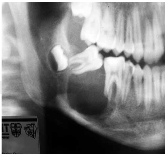
Figura 2. Detalle de la ortopantomografía inicial.