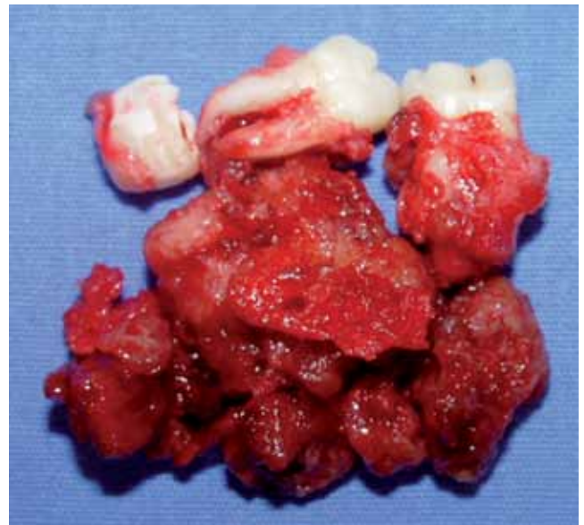
Figura 5. Pieza quirúrgica.

Svirsky (1986), analizó 15 casos de FOC, reportando una incidencia de 80% en la mandíbula, 60% en el sexo femenino y un rango de edad de 11– 80 años con una media de 29 años. 9