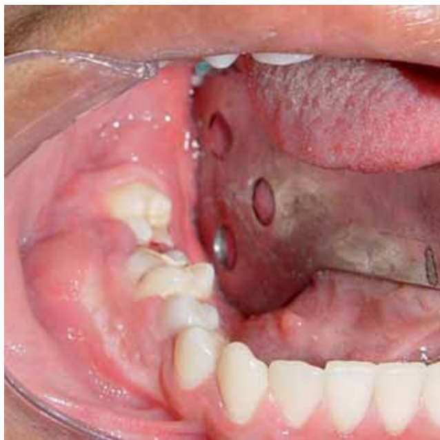
Figura 1. Aspecto clínico.

una serie de 3 casos. 5 Odell et al hace referencia a una serie de 10 lesiones con estas mismas características y sugiere que se trata de lesiones híbridas 6 y Mosqueda et al adicionan un caso a los ya reportados con el patrón histológico de ambas lesiones. 7 Son pocos los casos reportados de esta inusual lesión, agregando este nuevo caso a los ya publicados.