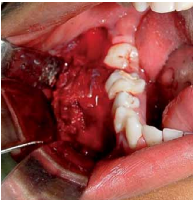
Figura 4. Aspecto transoperatorio.

El FOC puede aparecer a cualquier edad, más frecuentemente entre la 2ª y 4ª década de la vida, es dos veces más común en las mujeres que en los hombres. Puede presentarse tanto en el maxilar (zona anterior) como en la mandíbula (zona posterior). 8