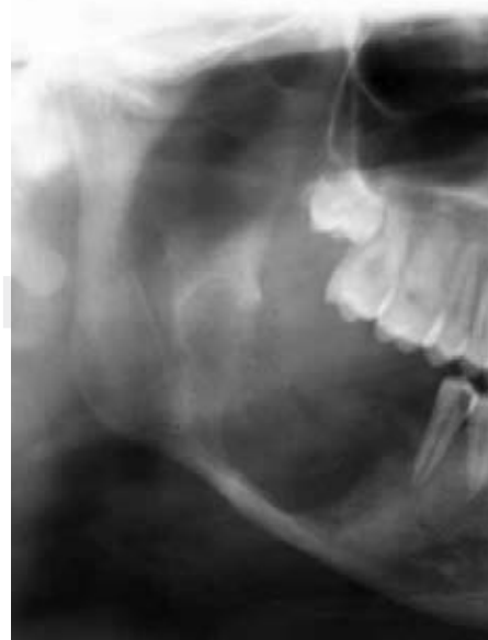
Figura 8. Detalle de la ortopantomografía de control.