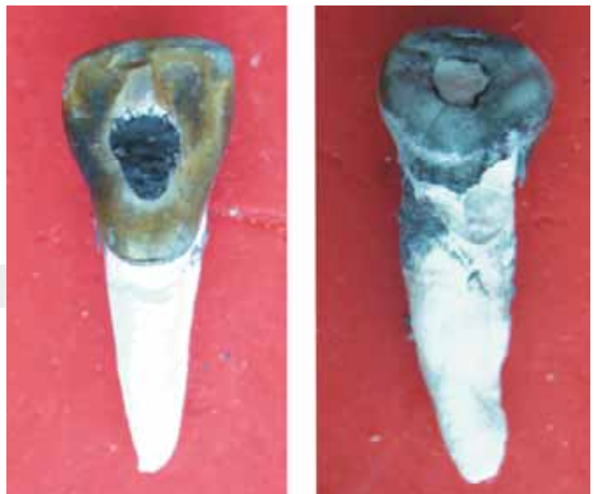
Figura 4. Dientes con obturación en amalgama (Izq.) y en resina compuesta (Der.) sometidas a 800 °C.