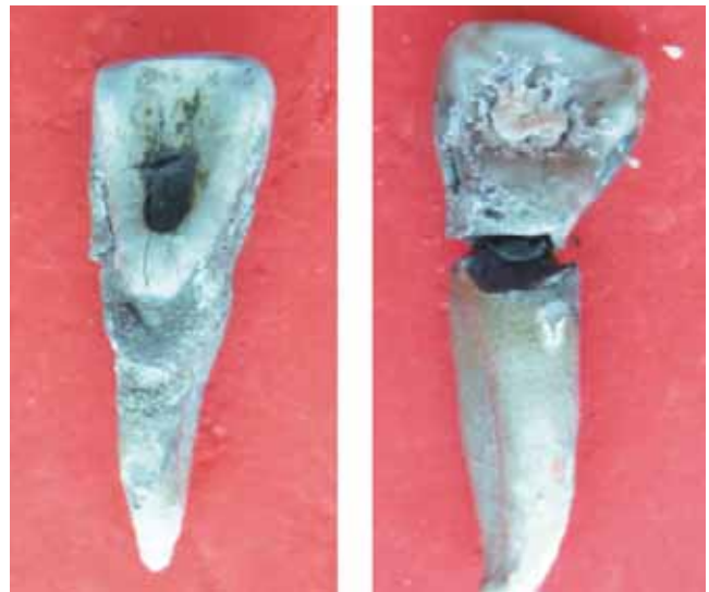
Figura 3. Dientes con obturación en amalgama (Izq.) y en resina compuesta (Der.) sometidas a 600 °C.

200 °C no se observan cambios significativos aunque hay pérdida de brillo (Figura 1). A los 400°C el cemento se apreciaba de color café oscuro asociado a la carbonización, con un aspecto cuarteado en el tercio cervical de la raíz y grietas longitudinales a lo largo de toda la raíz (Figura 2). A los 600 °C el cemento, cuarteado a lo largo de la raíz, cambió a un color café claro asociado a incineración con grietas longitudinales más profundas y largas (Figura 3). A los 800°C el