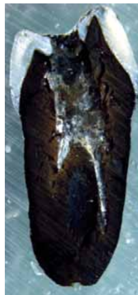
Figura 7. Corte sagital de un diente obturado con resina compuesta, gutapercha y cemento a base de resina epóxica sometido a 400 °C. Se pueden observar los materiales empleados en la obturación del conducto radicular carbonizados.