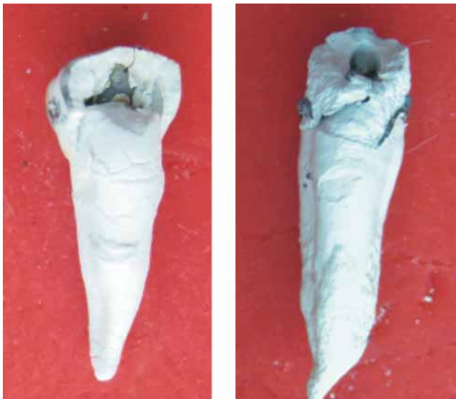
Figura 5. Dientes con obturación en amalgama (Izq.) y en resina compuesta (Der.) sometidas a 1,000 °C.

A los 200 °C, la amalgama sufrió desadaptación marginal, se tornó opaca y rugosa al formarse en su superficie nódulos por evaporación del mercurio (Figura 1). A los 400 °C, la amalgama se oscureció y se formaron grietas superficiales (Figura 2). A los 600 °C, la amalgama estaba de color negro y se perdieron las caracterizaciones morfológicas