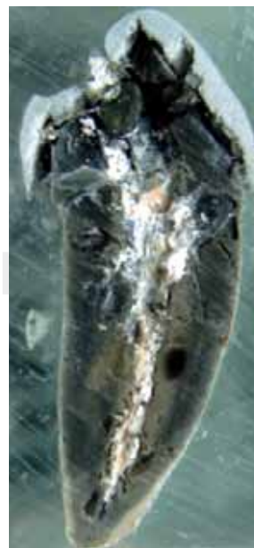
Figura 8. Corte sagital de un diente obturado con amalgama, gutapercha y cemento a base de óxido de zinc y eugenol sometido a 600 °C. Se pueden observar los materiales empleados en la obturación del conducto radicular incinerados.