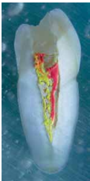
Figura 6. Corte sagital de un diente obturado con resina compuesta, gutapercha y cemento a base de resina epóxica sometido a 200 °C.