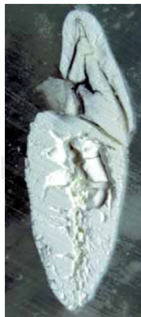
Figura 10. Corte sagital de un diente obturado con resina compuesta, gutapercha y cemento a base de resina epóxica sometido a 1,000 °C. Macroscópicamente no se distingue entre la dentina y los materiales empleados en la obturación del conducto radicular, los cuales se encuentran incinerados.

En los cortes sagitales, a los 200 °C se observó el material entre los conos de gutapercha sin cambios significativos. A partir de los 400 °C, el cemento y la gutapercha, ambos de color blanco, se incineran y no es posible diferenciarlos macroscópicamente (Figura