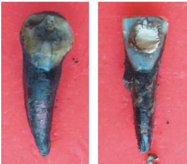
Figura 2. Dientes con obturación en amalgama (Izq.) y en resina compuesta (Der.) sometidos a 400 °C.