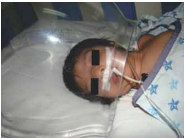
Figura 3. Paciente en sala de urgencia por deshidratación e hipernatremia después del intento fallido de alimentación oral.

Al día siguiente, se acude a solicitar la apertura del expediente clínico a consulta externa de pediatría, intentando probar succión y deglución, en donde el médico pediatra diagnosticó ausencia de dichos reflejos, ya que al momento de la alimentación hay escurrimiento de leche a través de las comisuras labiales debido a la incapacidad del paciente para deglutir; durante la realización de la historia clínica se observó evento de palidez y de pausa respiratoria, siendo estimulada inmediatamente y recuperándose instantáneamente, motivo por el que se refirió a urgencias prehospitalización (Figura 3). Debido al retiro de la sonda, la paciente tuvo eventos eméticos y deshidratación que condicionaron hipernatremia (aumento del nivel de sodio en sangre) lo que puede conducir a espasmos musculares y la muerte, además de la deshidratación propiamente y la desnutrición. Este caso es importante para resaltar el manejo interdisciplinario que debe imperar en todos los tratamientos de este tipo y no tomar decisiones unilaterales que pongan en riesgo