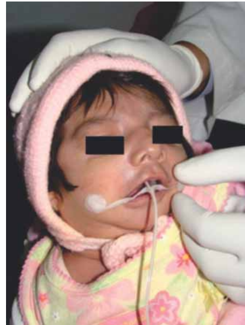
Figura 1. Aspecto inicial de la paciente portadora de sonda para alimentación asistida.

Se estimularon los reflejos de búsqueda y de succión, el primero se hizo acariciando la mejilla de la menor a lo cual encontramos una respuesta adecuada, ya que