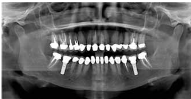
Figura 9. Radiográfica panorámica final.