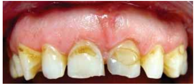
Figura 5. Cicatrización a los 3 meses.

A los 4 meses se colocaron provisionales supragingivalmente para no invadir espesor biológico durante la fase de cicatrización 13 y a los 6 meses se colocaron provisionales subgingivalmente (Figuras 5 y 6).