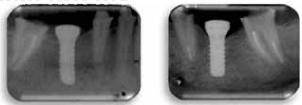
Figura 7. Radiografías dentoalveolares de implantes colocados en zona de dientes 36 y 46 (Straumann® SP WN Ø4.8 12 mm).