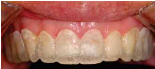
Figura 4. Guía quirúrgica de acrílico.