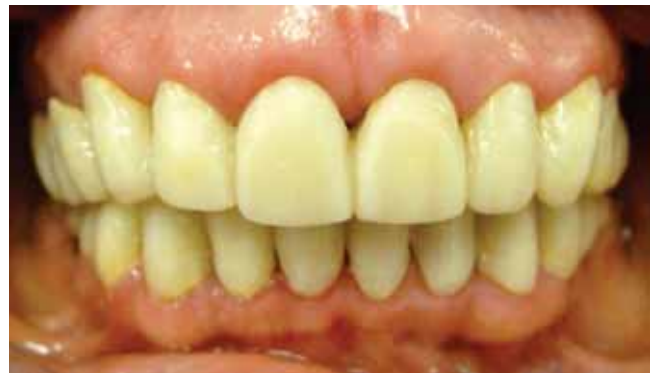
Figura 6. Provisionales. Características clínicas a 6 meses de los alargamientos de corona.

Los implantes reemplazaron los dientes ausentes de manera individual. La paciente se siente satisfecha ya que al sonreír no existe exposición excesiva de encía, cumpliéndose así con todas las expectativas tanto funcionales como estéticas (Figuras 8 a 10).