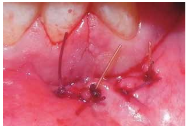
Figura 13. Sutura plano mucoso.