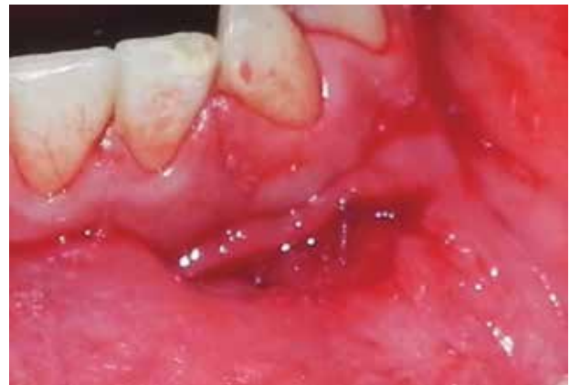
Figura 12. Sutura plano muscular.