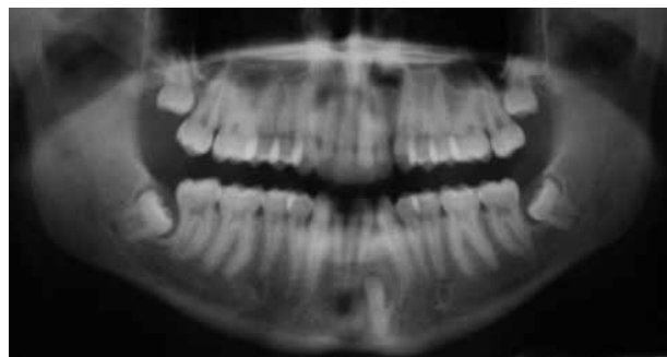
Figura 3. Ortopantomografía.

Al realizar examen intraoral se observa la ausencia del lateral inferior izquierdo. Dentro de los estudios ejecutados para valorar la existencia o no del lateral inferior se realiza la toma de una ortopantomografía (Figura 3) y una radiografía cefalométrica (Figura 4) como parte del protocolo de tratamiento ortodóntico que a su vez sirve como método de diagnóstico de la parte quirúrgica.