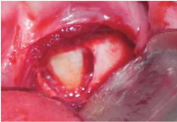
Figura 8. Ostectomía.