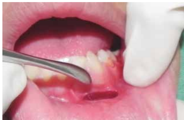
Figura 6. Incisión en mucosa labial.

La remoción quirúrgica se realiza mediante un colgajo de abordaje labial, ya que la pieza se encuentra en una posición muy apical y este colgajo nos ofrece un mejor acceso y facilita la exodoncia.