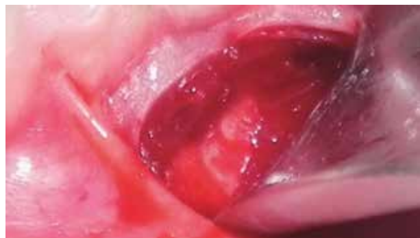
Figura 7. Una vez disecado el músculo y el periostio se logra acceder al hueso.