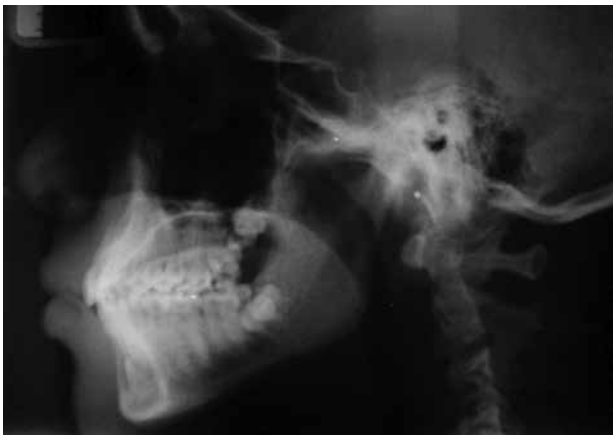
Figura 4. Radiografía Cefalométrica.