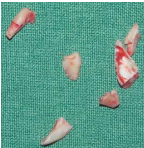
Figura 10. Diente extraído.