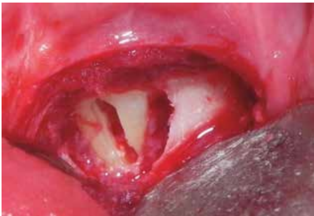
Figura 9. Odontosección.