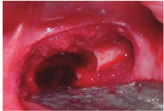
Figura 11. Alveolo una vez extraído el lateral mandibular impactado.