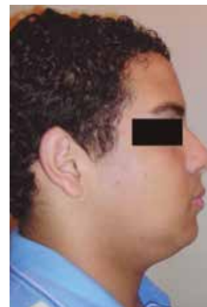
Figura 2. Foto perfil.

Al realizar examen intraoral se observa la ausencia del lateral inferior izquierdo. Dentro de los estudios ejecutados para valorar la existencia o no del lateral inferior se realiza la toma de una ortopantomografía (Figura 3) y una radiografía cefalométrica (Figura 4) como parte del protocolo de tratamiento ortodóntico que a su vez sirve como método de diagnóstico de la parte quirúrgica.