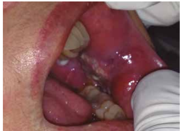
Figura 1. Inicial intraoral, mucosa yugal izquierda, lesión ulcerada, irregular, con induración, extendiéndose hasta la comisura, con áreas de leucoplasia y eritroplasia.

Realizados los estudios pertinentes se confirma el diagnóstico COCE en Etapa IV, fue un proceso desgastante y angustiante tanto para la paciente como para la familia. Le dieron 10 sesiones de radioterapia durante diez días continuos, la paciente fue asistida por un equipo multidisciplinario por un período de 5 meses, sin embargo, el proceso patológico estaba muy avanzado y sumado al compromiso sistémico lamentablemente la paciente falleció.