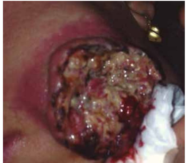
Figura 6. Lesión exofítica, ulceraciones, nódulos superficiales y desiguales con la presencia de necrosis.