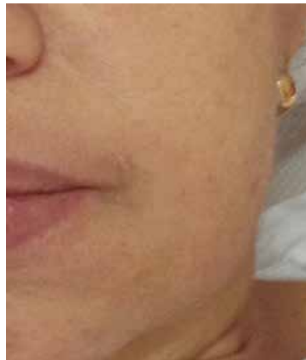
Figura 2. Inicial extraoral, no se observaron alteraciones de contorno facial o en piel.