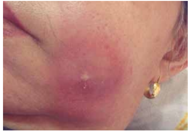
Figura 5. Fístula en mejilla a los quince días del hallazgo clínico.