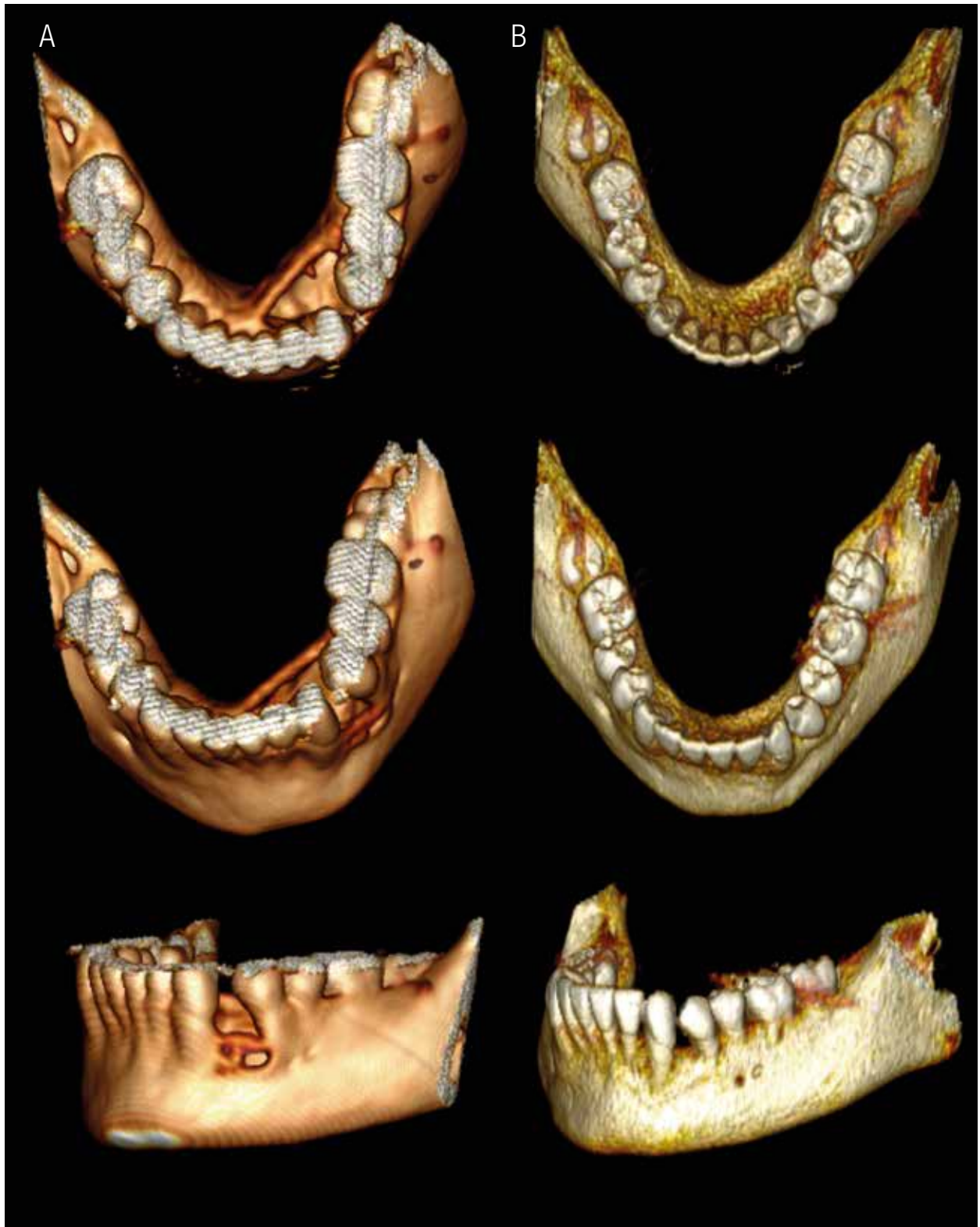
Figura 3. Reconstrucción 3D de la mandíbula. A. Vistas del TAC inicial donde se observa expansión de la cortical lingual, una zona osteolítica entre las piezas 3.4 a 4.2 y el desplazamiento de las piezas 3.3 y 3.4. B. Vistas del TAC a los 14 meses postenucleación revela que no existe evidencia de lesión residual a nivel mandibular.