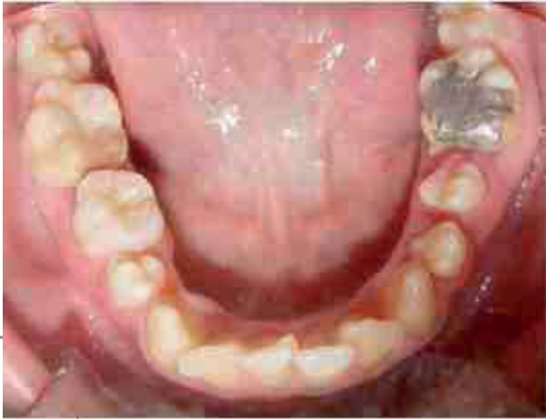
Figura 3. Microdoncia en primer premolar inferior derecho y en los segundos molares superiores e inferiores, alteraciones de forma en el primer premolar inferior izquierdo.