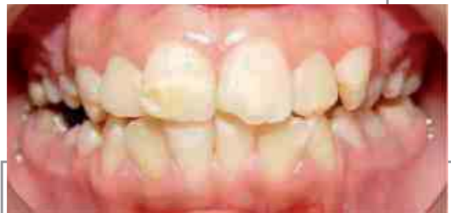
Figura 2. Defectos en la estructura del esmalte en los incisivos centrales superiores e incisivos lateral superior e inferior izquierdo.