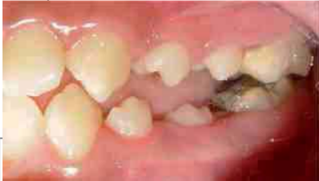
Figura 5. Microdoncia de premolares superiores e inferiores izquierdos.