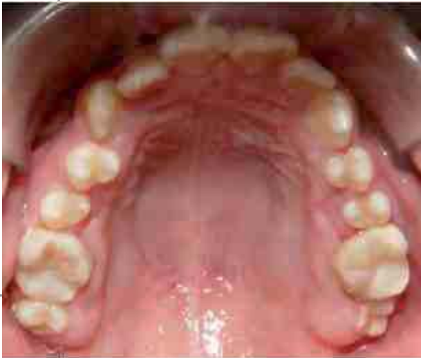
Figura 1. Microdoncia en los primeros y segundos premolares superiores y segundos molares superiores.

Los primeros molares permanentes completan la formación de la corona entre los dos y dos años y medio de edad, justamente la edad en la que se administró el tratamiento de quimioterapia lo cual causó alteración en la actividad de los odontoblastos, la quimioterapia produce también disturbios en los ameloblastos en el mecanismo de transporte del calcio en los microtúbulos lo cual resultó en defectos en el esmalte tales como la hipomineralización, de igual forma puede interferir con la absorción de la matriz orgánica del esmalte o en la remoción de las proteínas de la matriz del esmalte produciéndose hipomaduración del mismo, lo cual explica las alteraciones en los primeros molares e incisivos; así mismo en el caso de los premolares fue alterada la diferenciación celular lo cual causó alteración en la forma y en el tamaño de los mismos. 8,9,10