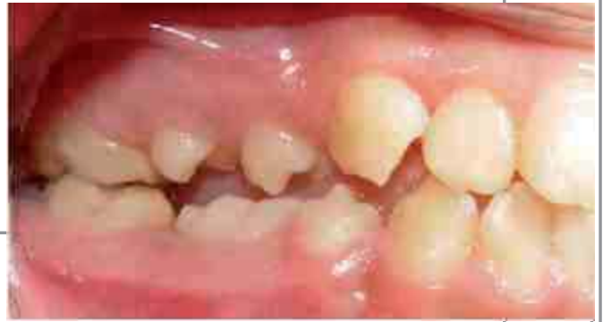
Figura 4. Microdoncia en premolares superiores y primer premolar inferior derecho.