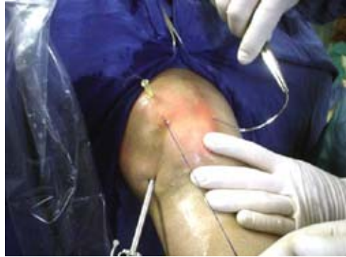
Figura 1. Colocación de puntos del retináculo medial, obsérvese la aguja para localización y orientación, la óptica se encuentra en el portal anterolateral.

Después de la exploración habitual por el portal anterolateral, se identifica el retináculo medial, se pasan puntos de sutura absorbible de calibre grueso, desde la piel junto a la patela emergiendo lo más dorsal posible sobre el retináculo medial ( Figura 1 ); este punto se hace coincidir en forma subdérmica con el orificio inicial de entrada de tal suerte que los dos extremos del hilo salen por un solo orificio ( Figura 2 ); a continuación se anudan y se presionan hacia la dermis desapareciendo de la superficie; si se dejan a la vista hay riesgo de infección superficial, por lo que debe evitarse esta situación empujando con una pinza y levantando gentilmente la piel. Se colocan tres puntos siguiendo el retináculo medial. Antes de anudarlos deben cortarse ambos retináculos, cuidando de no seccionar los puntos bajo control directo del artroscopista ( Figura 3 ). Para lograr una mejor posición de la patela, se presiona manualmente dicho hueso en sentido medial, al momento de hacer los nudos. Finalmente se comprueba el deslizamiento patelofemoral. Es posible colocar más puntos, para lograr un mejor deslizamiento, sin embargo, si no se