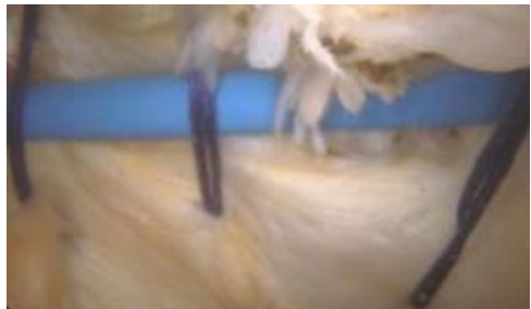
Figura 3. Puntos de sutura del retináculo medial con instrumento de radiofrecuencia para el corte del retináculo.