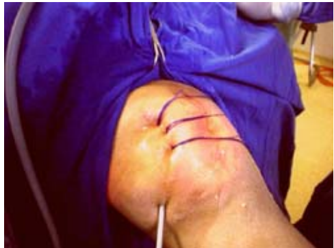
Figura 2. Tres puntos de sutura recuperados por tres orificios, obsérvese la flecha que señala la salida original del punto distal.