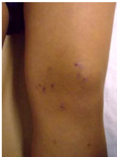
Figura 4. Estado postoperatorio mediato con heridas de m1nima invasi3n y buen resultado est1tico.

La realineaci3n proximal es un instrumento terap1utico valioso tanto con m1nima invasi3n como en cirug1a abierta. Es importante descartar enfermedad angular y lateralizaci3n del tub1rculo anterior de la tibia antes de la realineaci3n. El pron3stico depende de una adecuada alineaci3n y de la presencia de deterioro condral.