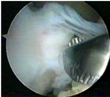
Figura 1. Imagen artroscópica de un cuerpo libre de 2 x 2 cm, alojado entre los ligamentos cruzados.

Se decidió por la segunda alternativa, debido a la edad de la paciente, al daño existente en la articulación patelofemoral ( Figura 2 ) y a que no había inestabilidad patelofemoral.