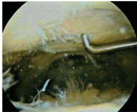
Figura 2. Imagen artroscópica de la pateloposterior a la primera artroscopia, obsérvese la denudación del hueso sin alguna posibilidad de regeneración.