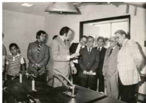
Figura 4. En la inauguración de la Central Médico-Quirúrgica de Aguascalientes, el doctor De Alba muestra la mesa ortopédica al C. Gobernador del Estado, Prof. J. Refugio Esparza Reyes y a sus acompañantes.