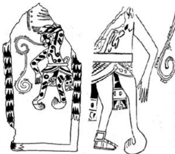
Figura 1: Pinturas murales de la zona arqueológica de Teotihuacán que relacionan la presencia del pie equinovaro con las culturas prehispánicas de Mesoamérica. Fuente: Copias de los murales de Atetelco en el Museo Nacional de Antropología de México . Matos E. Anomalías del pie en murales y códices prehispánicos. Anales de Antropología . 1972; 9: 96-97.

Un importante registro de la cultura maya se ve perdido en un acto atroz que ocurrió en 1549 por el obispo de Yucatán, quemando libros y documentos que eran el registro tangible de las tradiciones y conocimiento del mundo maya. Fortuitamente a esta acción se encuentran resguardados tres códices: Dresdenensis , Tro y Peresianus que nos permiten acercarnos y atestiguar tan sólo un poco del imponente conocimiento que poseía el pueblo maya. 11-19