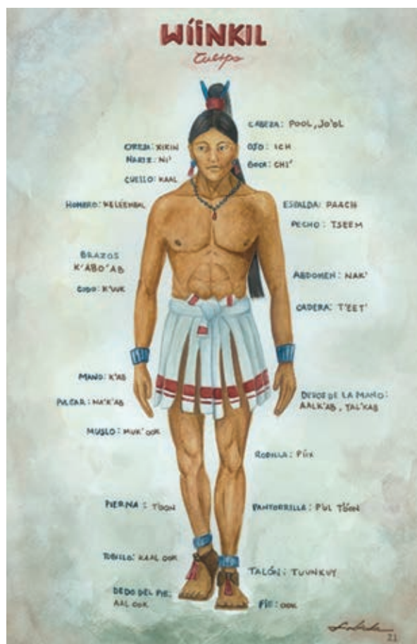
Figura 4: Representación del cuerpo en la cultura maya, partes del cuerpo en lengua maya. Fuente: Dibujo original de Fabiola Ruiz Téllez.