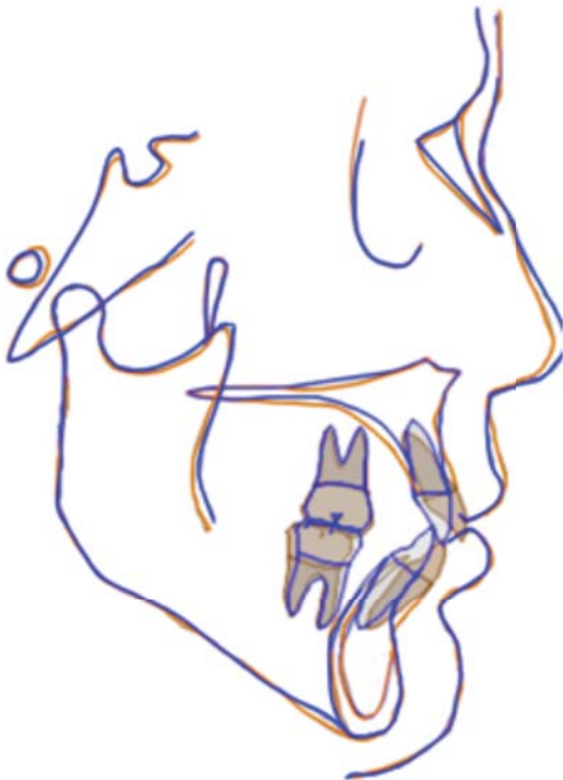
Figura 9. Sobreimposición pre y posttratamiento.

Fase II: se colocaron arcos 0.020" australianos superior e inferior con hélix a mesial de los caninos y se inició con el uso de E-Links para el cierre de espacios (Figura 5).