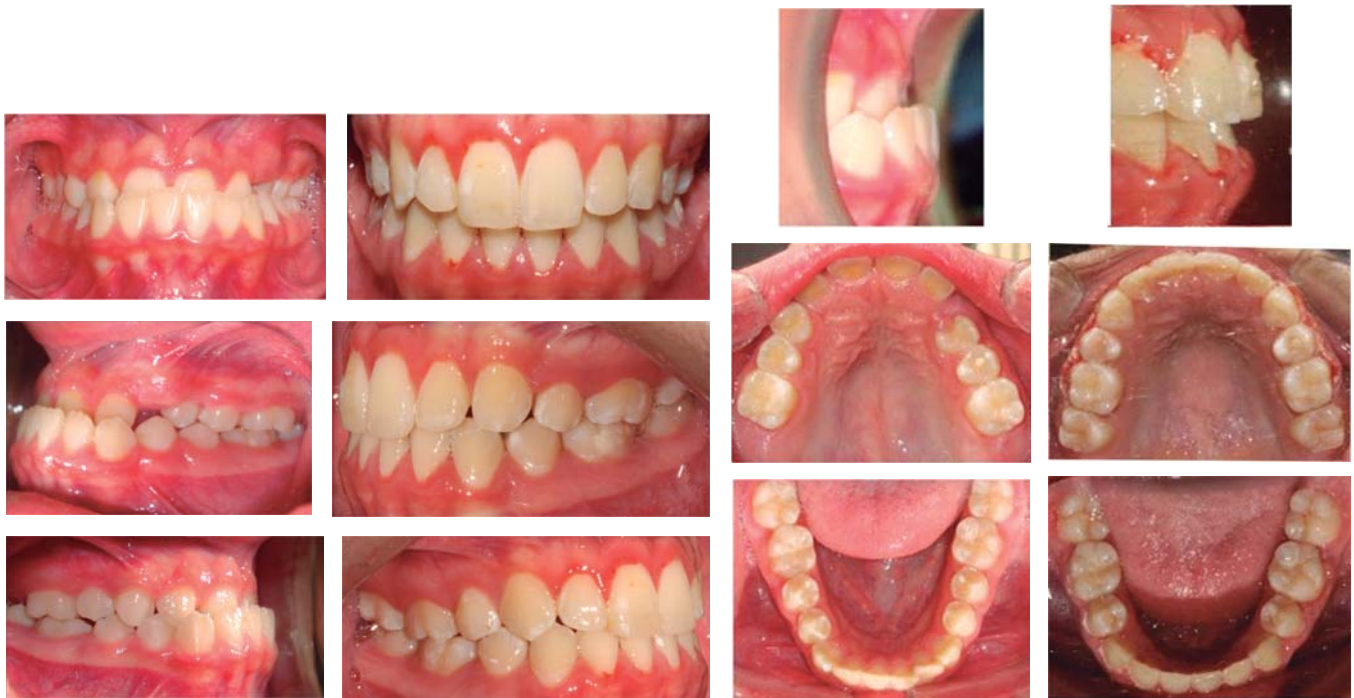
Figura 7. Fotografías comparativas extra e intraorales iniciales y finales del tratamiento.