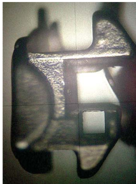
Figura 2. Bracket In-Ovation.

La pérdida de torque anterior se puede dar cuando hay deformación de los brackets debido al material con que está fabricado y al proceso de fabricación. También puede existir esta pérdida de torque cuando se utilizan dimensiones pequeñas de alambres rectangulares o cuando los ángulos internos de la ranura de los brackets son redondeados, lo que evita un íntimo ángulo de contacto entre el arco de alambre y la ranura del bracket. 2,4