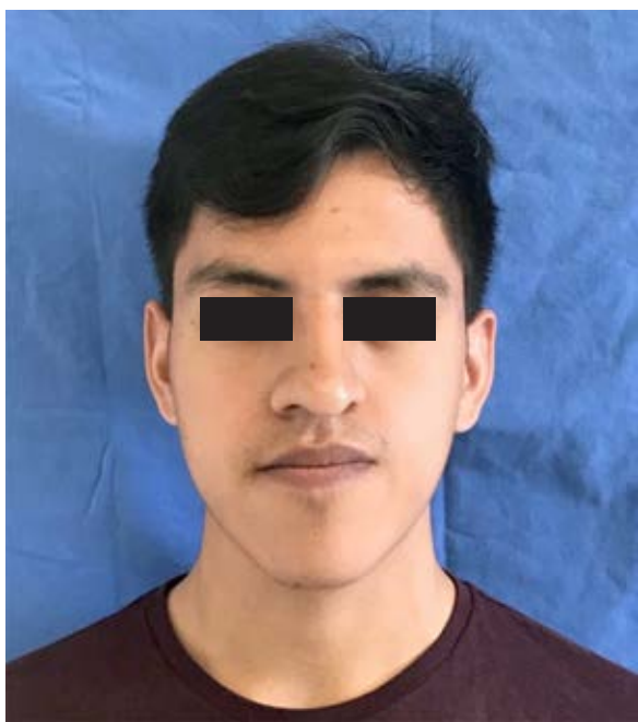
Figura 1: Fotografía frontal donde se observa distopia, enoftalmos izquierdo e hipoplasia de la región nasomaxilar.

Front photograph where dystopia, left eye enophthalmos, and hypoplasia of the left nasomaxillary region are observed.