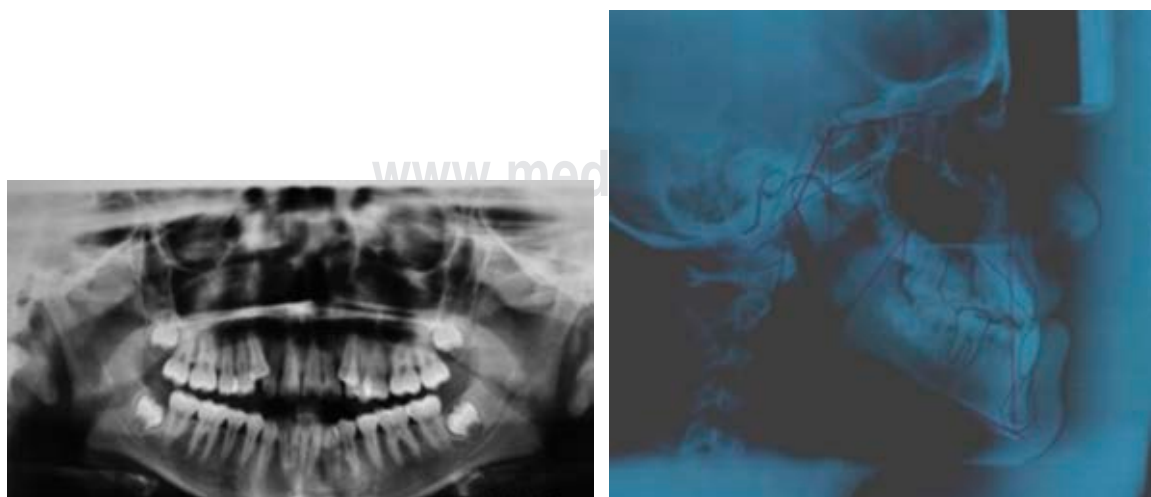
Figura 2: Radiografías iniciales. Initial radiographs.