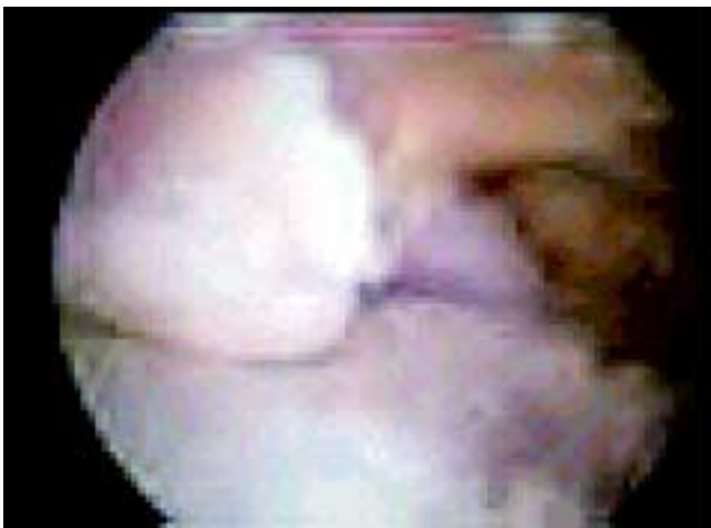
Figura 3. Lesión del domo del astrágalo con fragmento libre intraarticular imagen artroscópica.

En pacientes con diagnóstico de pinzamiento anterior se visualizó osteófito tibial anterior, al cual se realizó inicialmente sinovectomía anterior y resección de osteófito con rasurador cuidando de no lesionar estructuras vasculonerviosas anteriores. En un caso con dolor inexplicable de tobillo se realizó exploración exhaustiva de la articulación,