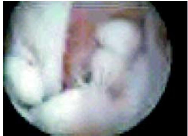
Figura 4. Cuerpos libres intraarticulares en artroscopia de tobillo.

encontrando en la región posterolateral y entre los tendones peroneos un cuerpo libre cartilaginoso, el cual fue extraído con pinza sujetadora de pequeñas articulaciones.