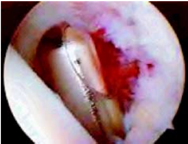
Figura 2. Sinovectomía con el uso de rasurador en artroscopia de tobillo.

En aquellos pacientes con diagnóstico de osteoartrosis, se observó condromalacia postfractura localizada, en el domo del astrágalo y en la bóveda tibial ( Figura 3 ), por lo que se realizó condroplastía con el uso inicial de rasurador y posteriormente con el uso de VAPR MR para regularizar la superficie articular. Se realizó en dos pacientes sección meticulosa de fibrosis alrededor del aspecto lateral del astrágalo y excisión de fragmentos de hueso.