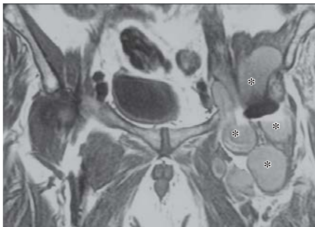
Figura 3. Resonancia magnética nuclear (corte coronal de pelvis, ponderado en T1). Masa quística de 15 x 8 cm polilobulada (*), de contenido heterogéneo con focos hiperintensos, entre la prótesis total de cadera (artefacto negro central) y el plano profundo del músculo ilíaco, siguiendo el eje de la arteria ilíaca y femoral.

Las partículas de polietileno procedentes de su desgaste tienen una importante acción biológica como inductora de la cascada reactiva tisular que conduce a la reacción a cuerpo extraño, donde los macrófagos reaccionan ante las partículas con apoptosis y la liberación de citoquinas que inducen a la osteoclastogénesis. 7 Como consecuencia de esta cascada se produciría formación en exceso de líquido sinovial, provocando aumento de la presión con la consiguiente hipertrofia de las vellosidades de la membrana sinovial de la bolsa del psoas. 8,9 La dirección y el grado de extensión de la bursa determinan la sintomatología clínica. Puede originar dolor en cara anterior de la cadera, masa ilioinguinal, flexión de la cadera, resistencia a la extensión, cadera en resorte y compresión de estructuras adyacentes en el abdomen o en el retroperitoneo, 10,11 siendo descrita la compresión de la vena femoral, con trombosis de la vena femoral por otros autores. 2,12,13