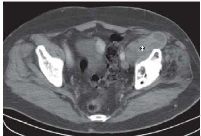
Figura 2. Estudio tomográfico de la pelvis que muestra una tumoración quística lobulada (*) en fosa ilíaca izquierda de unos 7 cm de diámetro.

La formación quística ocasionada por la enfermedad del polietileno tras la colocación de una artroplastía total de cadera es poco frecuente. 3 Fue reportada, por primera vez, por Kolmert y colaboradores; 4 posteriormente, Steinbach y su grupo, 5 así como Berquist y asociados, 6 informaron entre seis y 12 casos de bursitis del músculo psoas ilíaco, respectivamente.