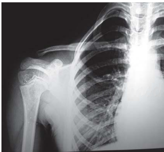
Figura 2. Radiografía anteroposterior del hombro derecho con fractura consolidada (secuencia de la figura 1). Se aprecia callo por osificación endocranal y el restablecimiento de la alineación en el plano frontal.