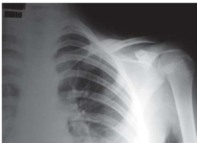
Figura 5. Radiografía anteroposterior de hombro izquierdo (secuencia de la figura 4 ), que corresponde a un paciente mayor de 9 años, donde se observa consolidación radiográfica de la fractura de clavícula. Persiste el cabalgamiento de los fragmentos y acortamiento clavicular.