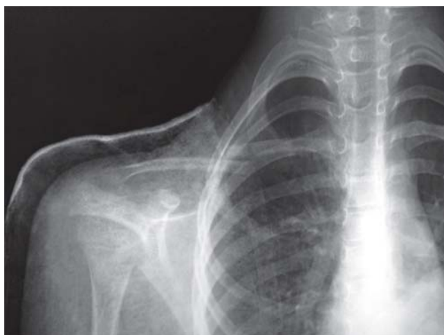
Figura 1. Radiografía anteroposterior del hombro derecho inicial a la fractura. Paciente de 8 años con acortamiento relativo de 15% y desplazamiento de 100%.

Para medir radiográficamente el acortamiento de la clavícula fracturada, elegimos la proyección anteroposterior comparativa de hombros. 14 Como puntos de referencia, tomamos la parte medial de la articulación esternoclavicular y la parte lateral de la articulación acromioclavicular. El acortamiento podía estar dado por angulación pura o cabalgamiento de la fractura. No hicimos diferencia entre la etiología del acortamiento, únicamente se registró la cifra del acortamiento. Para esto, asignamos el valor de 100% a la longitud de la clavícula sana y otorgamos un porcentaje de acortamiento a la clavícula fracturada.