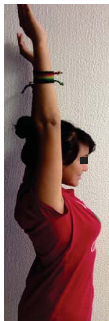
Figura 7. Fotografía clínica de la extensión del hombro después de 2 años ocurrida la fractura en un paciente mayor de 9 años.

El mayor número de pacientes se encontró en aquellos menores de 9 años de edad, contando con 66 pacientes (70%