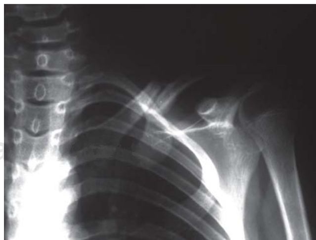
Figura 4. Radiografía anteroposterior del hombro izquierdo correspondiente a un paciente mayor de 9 años donde se aprecia la fractura de clavícula inicial. Con desplazamiento de 100% y acortamiento relativo medido de 17%.