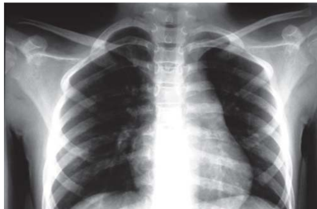
Figura 3. Radiografía anteroposterior panorámica mostrando ambos hombros (secuencia de las figuras 1 y 2). Paciente de 8 años de edad, 1 año de la fractura, donde se aprecia callo óseo en la clavícula derecha. El restablecimiento de la alineación en el plano frontal y un acortamiento final medido menor a 5%.