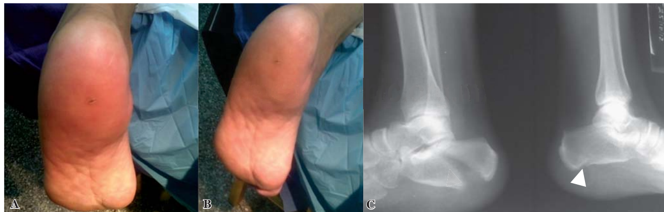
Figura 2. A y B. Aspecto clínico del pie, con edema y deformidad. Se observa la cicatriz del abordaje plantar en el talón. C. Imagen radiológica de la derecha donde se observa el sitio de lesión de la cortical inferior del calcáneo. Izquierda, radiografía donde se evidencia fractura del calcáneo.