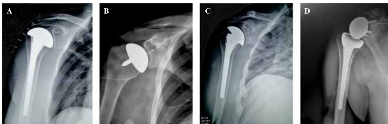
Figura 1. Tipos de prótesis. (A) Hemiprótisis, (B) Resuperficialización, (C) Prótisis total anatómica y (D) Prótisis total de anatomía reversa.