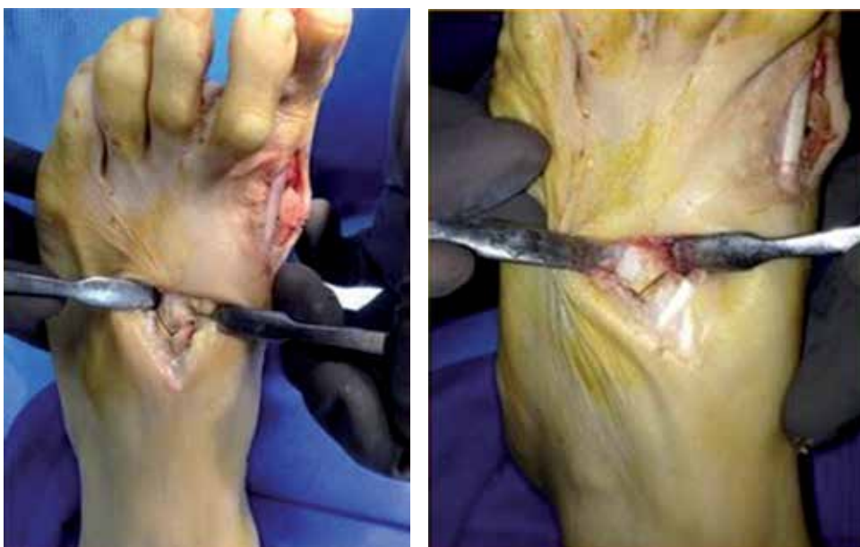
Figura 3. Osteotomía tipo Golfar, para metatarsianos centrales.