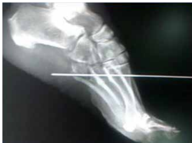
Figura 5. Osteotomía proximal de elevación al quinto metatarsiano.

coloca un vendaje especial para mantener la elevación de la cabeza de los metatarsianos y se protege con un zapato de marcha. Al día siguiente del postoperatorio iniciamos marcha asistida con muletas; a la sexta semana del postoperatorio se indica zapato normal.