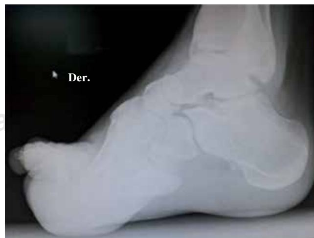
Figura 2. Imagen radiográfica de un pie cavo anterior donde se muestra el efecto óseo del imbalance muscular.

Muchas soluciones quirúrgicas y no quirúrgicas han sido descritas para tratar la enfermedad de CMT, por ejemplo: procedimientos a partes blandas (alargamiento de la fascia