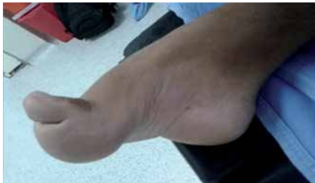
Figura 1. Características clínicas del pie cavo, varo y dedos en garra.

CMT-4: defecto autosómico recesivo; se describen defectos en diferentes cromosomas; aún se encuentra en estudio.