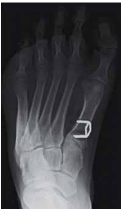
Figura 4. Osteotomía dorsal al primer metatarsiano.