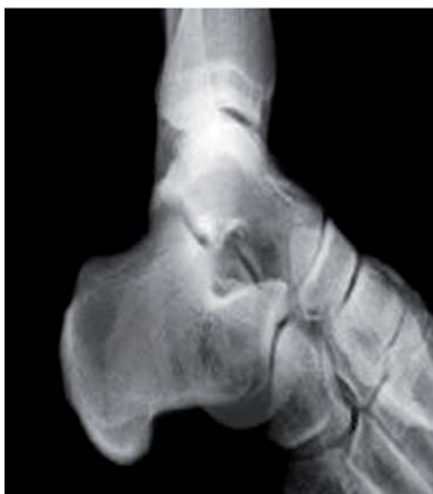
Figura 1. Radiografía lateral del tobillo izquierdo con el pinzamiento posterior.

Segunda cirugía (16 de Julio de 2011): Dos meses después de la primera cirugía, se realiza incisión medial, localizando maléolo medial, parte distal y medial del tendón calcáneo y parte inferior del calcáneo. Se incide en «L» de 15 cm aproximadamente de longitud; se disecciona por planos, identificando el ligamento lacinado; se incide longitudinalmente y de proximal a distal se disecciona, retirando el tejido graso abundante; se localiza plexo venoso tortuoso, donde al incidir el tejido graso se observa una herniación del paquete neurovascular medial del tobillo; se libera el plexo venoso hacia distal, donde se observa atrapamiento del nervio tibial posterior y sus ramas de manera circunferencial, lo que ocasiona la compresión severa; se liga una de las venas del plexo de Lazhortes y se disecciona, liberando el paquete intervacular. Se desinserta el músculo abductor del primer dedo, localizando las ramas calcánea medial, plantar lateral