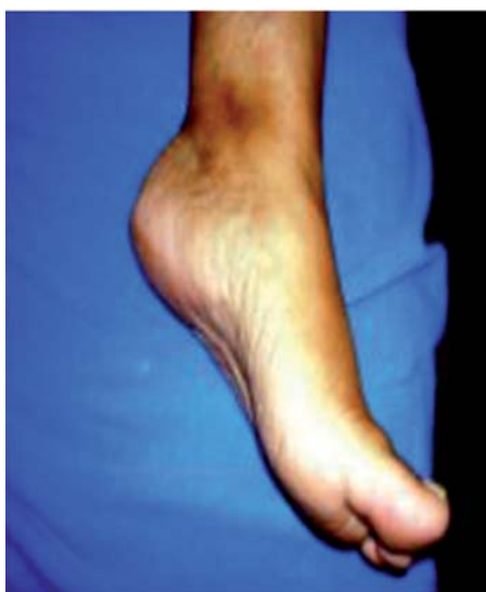
Figura 3. Imagen clínica del tobillo izquierdo.

Una de las causas es la compresión intrínseca secundaria a tumores, várices o modificaciones de la anatomía del túnel del tarso; sin embargo, —lo que es menos frecuente, pero muy importante— las várices por insuficiencia venosa pro-