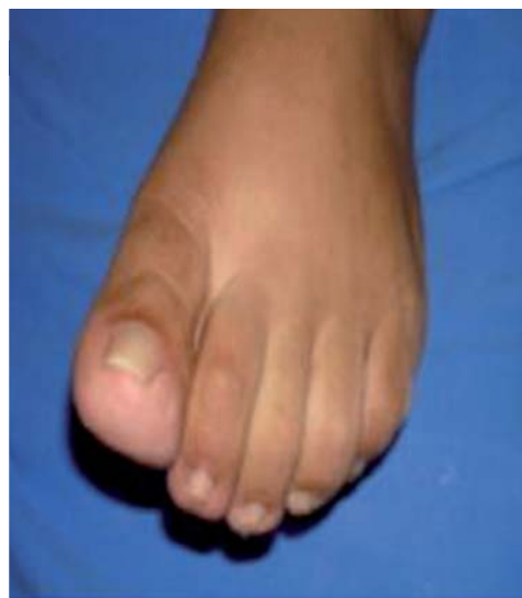
Figura 4. Limitación para la flexión plantar del primer dedo.