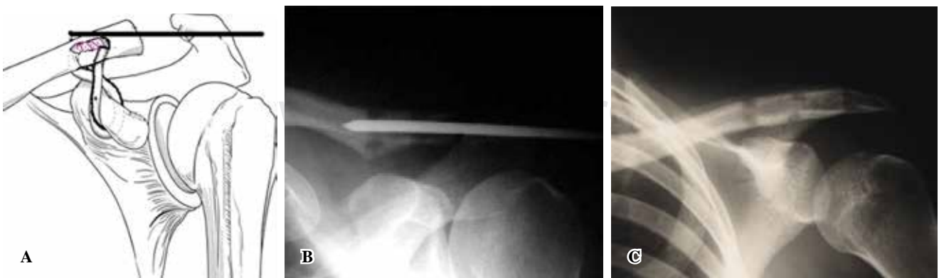
Figura 2: A) Dibujo del injerto colocado, resección clavicular y clavo para mantener la alineación acromioclavicular. B) Radiografía postoperatoria. C) Relación acromioclavicular postoperatoria después de retirado el clavo, en otro caso.

A) Toma del injerto del peroneo lateral corto. B) Preparación del injerto. C) Resección del extremo clavicular. D) Perforación de los orificios en la clavícula. E) Paso del injerto tendinoso por los orificios. F) Fijación de la clavícula con un clavo de Steinmann.