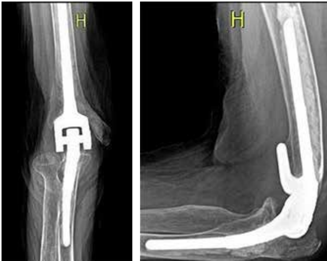
Figura 4: Control radiológico cuatro años postoperatorio que muestra prótesis sin signos de aflojamiento.

Arco de movilidad articular codo derecho comparado con el izquierdo A) extensión. B) flexión. C) Pronación. D) supinación.