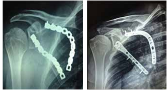
Figura 6: Radiografías postquirúrgicas de pacientes 1 y 2.

Existen múltiples abordajes como el enfoque en U invertido descrito por Abbott y Lucas o el abordaje posterolateral directo (Dupon-Evrard, Kavaganah), sin embargo presentan la desventaja de tener un acceso limitado a la cavidad glenoidea y al cuerpo escapular, así como la dificultad para extender el mismo. 10 Otra opción es el descrito por Hardegger y Kavanagh, que consiste en una incisión vertical desde el acromion al ángulo escapular inferior, pero se dificulta la liberación del deltoides posterior. 17 Pizanis describió un abordaje posterior de dos portales al cuello glenoideo y escapular, mientras que Gauger propone miniincisiones múltiples para acercarse a diferentes partes de la escápula; ambos abordajes son técnicamente difíciles y tampoco exponen todo el cuerpo, el cuello ni la superficie articular glenoidea, lo que dificulta una reducción adecuada. Wirth propone un abordaje de división