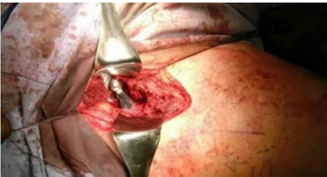
Figura 2: Acceso anterior de cadera.

componente definitivo no cementado. Se toman controles con fluoroscopia y rayos X, se coloca drenaje de \frac{1}{4} y se cierra por planos. Artroplastía total primaria de cadera con abordaje lateral: con el paciente en decúbito lateral, técnica aséptica, incisión de 12 cm de 4 cm proximal a la punta del trocánter mayor en dirección hacia la diáfisis del fémur, pasando por el trocánter mayor en su porción media, se incide el músculo glúteo medio dejando un tercio anterior y dos tercios posteriores del tendón y vientre muscular. Se prepara acetábulo y se colocan componentes de prueba y definitivo con tornillos 6.5 mm así como inserto. Se realiza osteotomía del cuello femoral, se prepara canal femoral con rimas convencionales y se coloca componente definitivo no cementado. Se toman controles con fluoroscopia y rayos X. Se coloca drenaje de \frac{1}{4} y se cierra por planos. Artroplastía total primaria de cadera con abordaje posterior: con el paciente en decúbito lateral, técnica aséptica, incisión de 14 cm que siga la curvatura de tres puntos de referencia: la espina posterosuperior, el trocánter mayor y la diáfisis femoral, se incide el músculo glúteo mayor, se refieren y se inciden los músculos rotadores externos cortos de la cadera. Se prepara acetábulo y se colocan componentes de prueba y definitivo con tornillos 6.5 mm así como inserto. Se realiza osteotomía del cuello femoral, se prepara canal femoral con rimas convencionales y