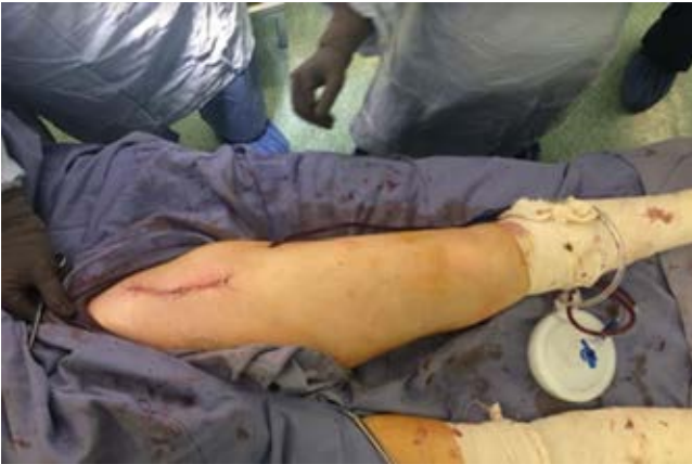
Figura 1: Cicatriz del abordaje anterior.