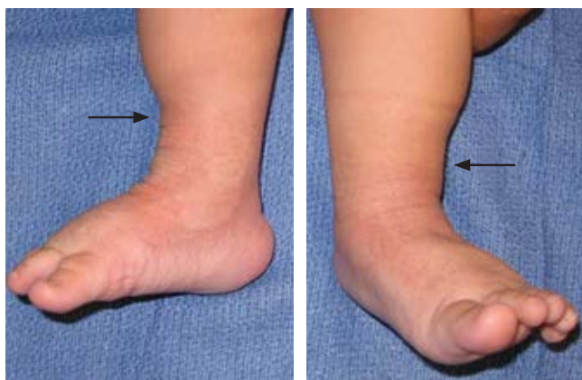
Figura 4: Se observa signo de la familia obediente (flechas).

del paciente sobre la importancia de su papel en el tratamiento de la patología de su hijo, se observó una evolución favorable y ausencia de deformidades residuales en las consultas de seguimiento.