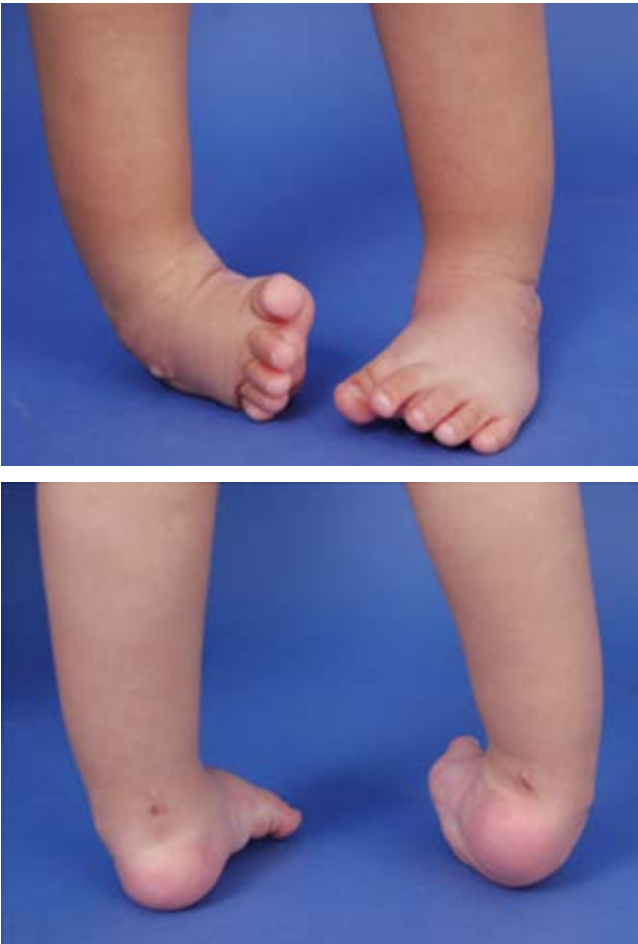
Figura 2: Deformidad residual al año, 10 meses de edad.

tenotomía bilateral del tendón de Aquiles con posterior reinicio de la barra abductora «23 horas por día». No obstante, de nuevo no contamos con la certeza absoluta del apego adecuado del paciente y los familiares al tratamiento con la barra abductora.