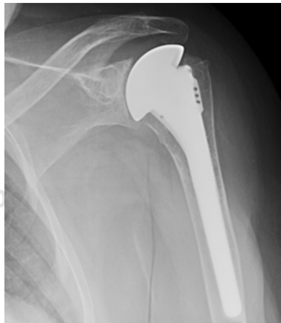
Figura 3: Radiografía AP al final del seguimiento.

Garstman y colaboradores 13 en su estudio muestran una diferencia total de 54 puntos en las prótesis anatómicas y de 42 puntos en las HA al comparar el ASES preoperatorio con el postoperatorio. Además, reconocen que no hay diferencias estadísticamente significativas al comparar HA con AT en cuanto a la función, el rango articular, la fuerza ni la puntuación total de la escala ASES, aunque sí reconocen que las puntuaciones en AT son algo superiores. En nuestro trabajo, se aprecia una diferencia de 50 puntos entre el ASES prequirúrgico con el postquirúrgico, lo que es similar a lo encontrado por este autor para sus AT. Levine y su equipo de trabajo 16 hallaron 68 puntos en la escala ASES postopera-