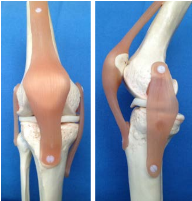
Figura 1: Representación del LCMs como estabilizador en valgo durante la flexión.

Sin olvidar que el estándar de oro para el diagnóstico de una lesión LCM es por medio de una exploración clínica, se pueden utilizar estudios de gabinete como herramientas auxiliares. Las radiografías deberían adoptarse para descartar cualquier fractura. Las radiografías en estrés son la técnica más precisa y reproducible disponible actualmente; sin embargo, sólo un número limitado de estudios han utilizado este método para documentar sus resultados posteriores a la reconstrucción del LCM. Una resonancia magnética puede ser útil para visualizar los ligamentos y otros tejidos blan-