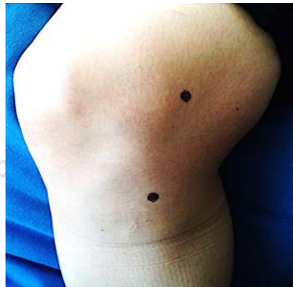
Figura 2: Identificación del sitio anatómico del sitio de origen del ligamento colateral medial.

teral de la rodilla para posteriormente fijarlo con un tornillo biocompuesto (BioComposite Interference Screw® Arthrex) en la región medial, simultáneamente se realizan maniobras en varo de 10-15° (Figura 4). Se hacen pruebas de estabilidad clínica y radiografías de estrés. Se cortan hilos de sutura