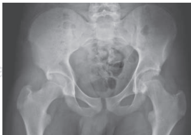
Figura 1: Radiografía simple del paciente obtenida en el área de urgencias donde no pueden observarse cambios significativos o alteraciones óseas evidentes.