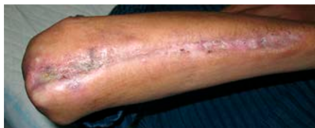
Figura 6: Resultado cutáneo a los seis años y medio.

un tiempo muy prolongado. A pesar de todo ello, no hubo infección precoz o tardía, la fractura se consolidó y hubo epitelización espontánea bajo la placa y adherida al hueso. La consolidación con malalineación del cúbito se debió al retiro de tornillos por el propio paciente, a la falta de supervisión postoperatoria y al uso inapropiado de la extremidad.