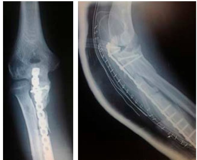
Figura 2: Radiografías en el postoperatorio inmediato, con placa cubital y tornillo en coronoides.