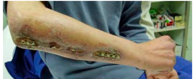
Figura 3: Postoperatorio luego de dos años. Dehiscencia de la herida quirúrgica con exposición de la placa cubital, sin signos de infección.