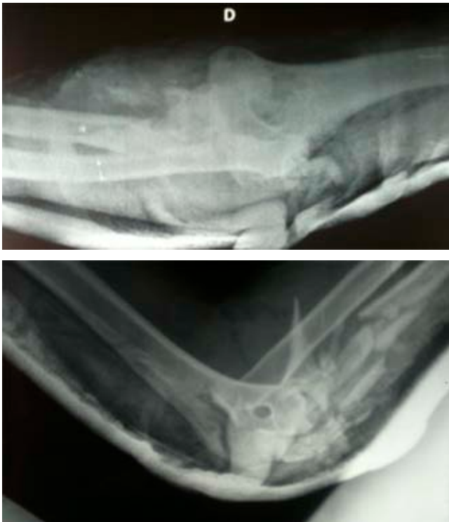
Figura 1: Radiografías del área de Urgencias, con inmovilización provisional.

En resumen, la dehiscencia de la herida quirúrgica con exposición de la fijación interna en una fractura de antebrazo, especialmente si se trata de una fractura abierta, parece tener el máximo riesgo de infección y pseudoartrosis, pero ¿siempre es así? Se presenta un caso de fractura-luxación de Monteggia, multifragmentaria y abierta, en la que ocurrió una dehiscencia de la herida quirúrgica con un largo tiempo de exposición de una placa de cúbito sin recibir tratamiento y que sorprendentemente no evolucionó a infección.